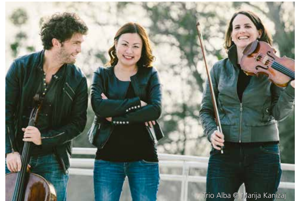
Trio Alba

: https://itunes.apple.com/us/artist/trio-alba/id645513923